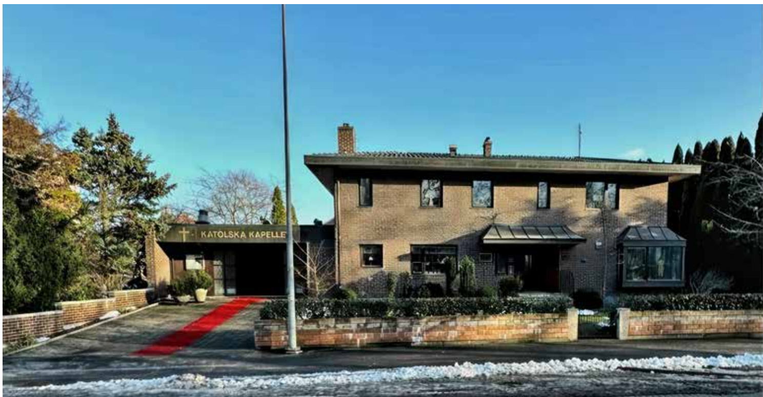
Renovering av S:ta Maria katolska kapell, Kristianstad