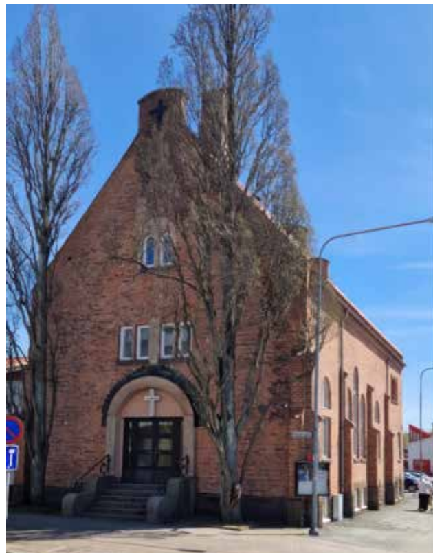
Renovering av kyrkorummet, Jesu Heliga Namns katolska kyrka, Nässjö