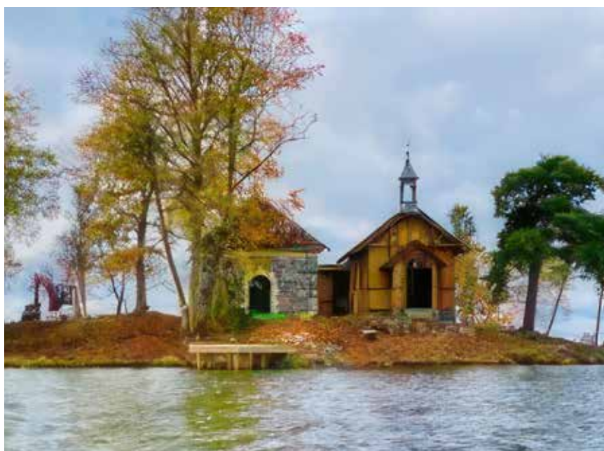
Upprustning av Mariaön, Ekerö