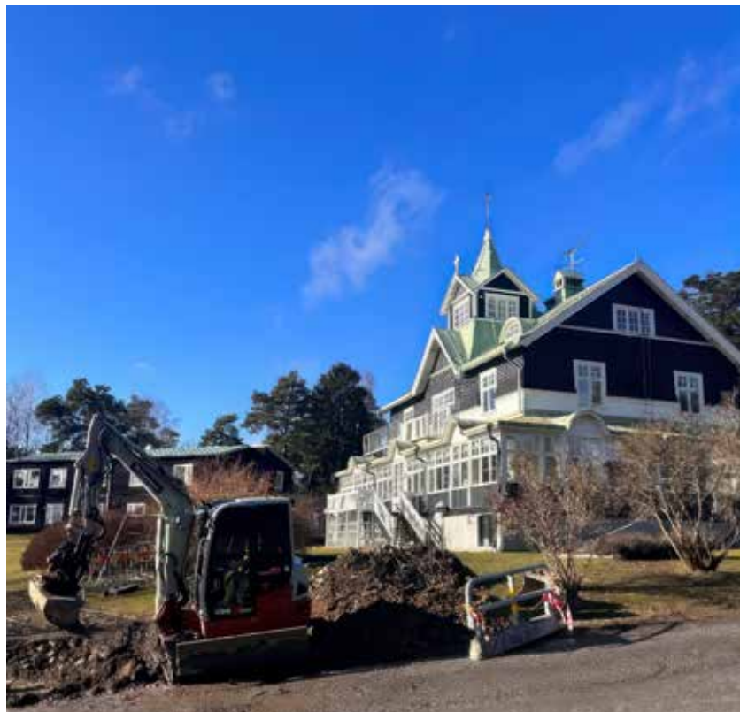
Infrastrukturellt projekt: upprustning av väg, parkeringsplatser, belysning och entré på stiftsgården Marielund