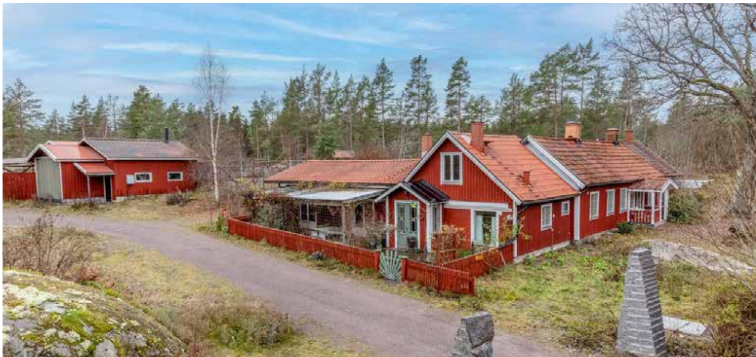
Nyförvärv: Sankt Josefs kloster (Marias Lamm kommunitet), Figeholm, Oskarshamns kommun