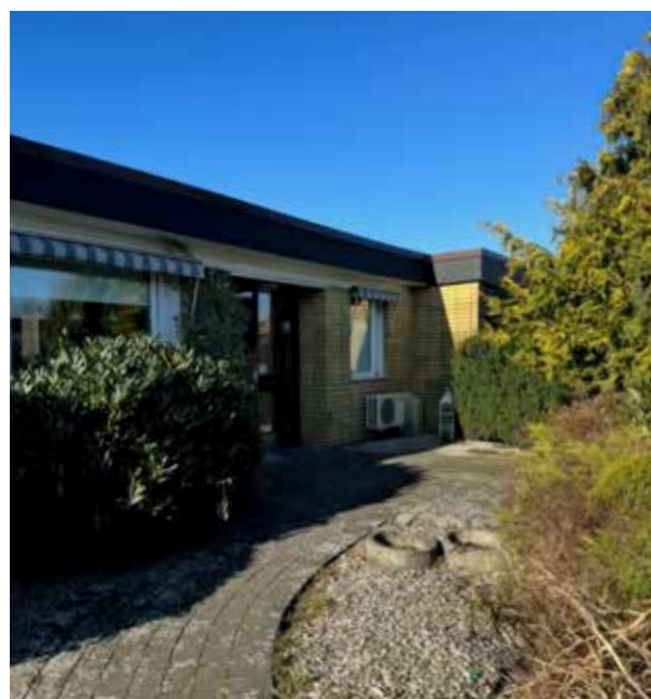
Upprustning av klostret Döttrar av Maria Barmhärtighetens Moder, Malmö