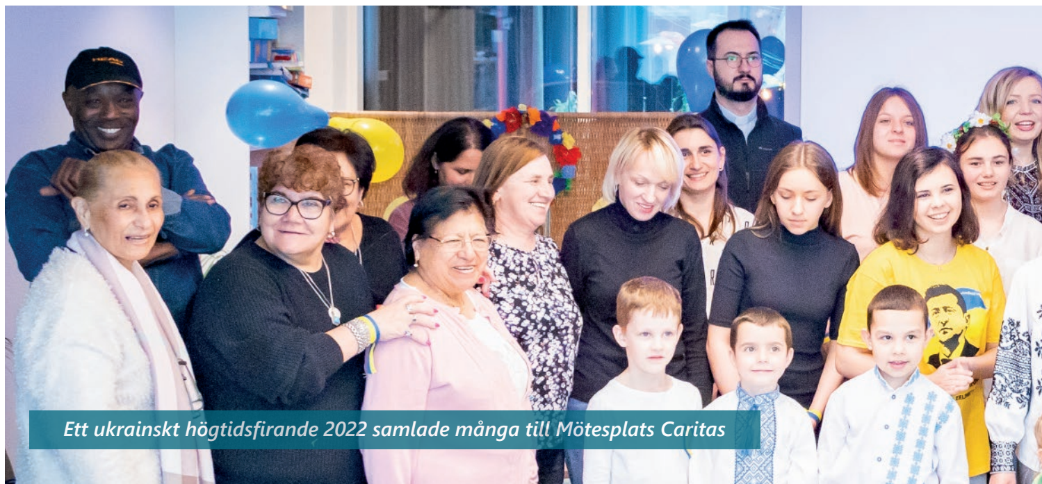
Ett ukrainskt högtidsfirande 2022 samlade många till Mötesplats Caritas

Kolla gärna om det finns någon i församlingen om det är någon som kan migrationslagstiftning. Även om det inte finns någon expert så kan man stötta mycket genom att hjälpa till att läsa dokument och beslut och försöka förstå dem. De allra flesta svaren om vad som gäller finns på Migrationsverkets hemsida. Det finns också expertis att tillgå för mer kniviga frågor på Caritas Sverige eller på Asylrättscentrum som stöds ekonomiskt av Stockholms katolska stift.